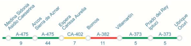
Ruta Romana del Interior, distancia total: 99km