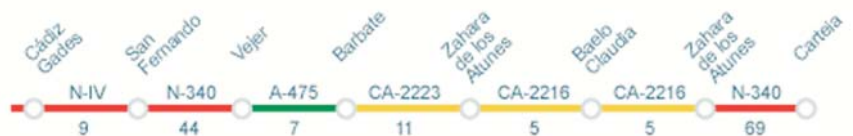
Ruta Romana de la Costa, distancia total: 149km